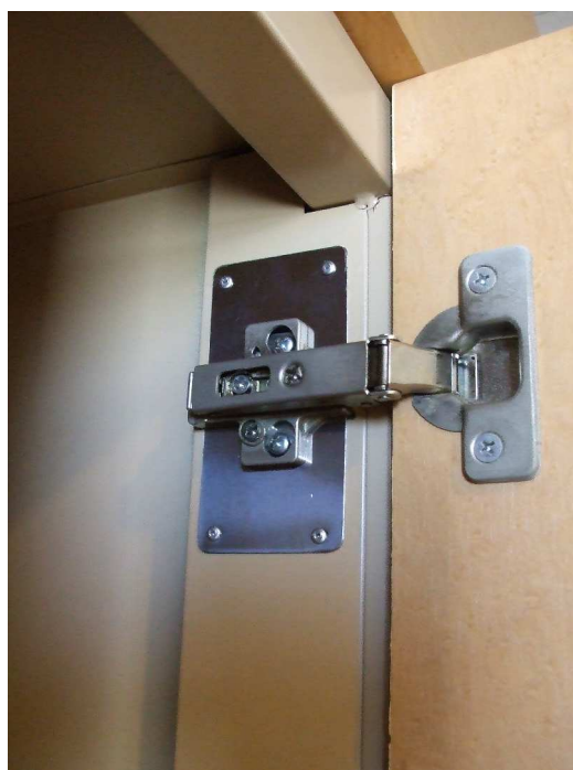
座金部分にステンレスの補強板を 取付け初期の使用感になりました